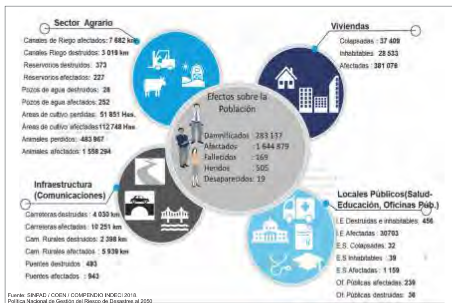
Gráfico 2. Afectaciones en la población y medios de vida por los desastres tras el Niño Costero 2017.

puesto que, producto de las lluvias intensas e inundaciones miles de familias quedaron sin vivienda, y agricultores, pescadores artesanales, comerciantes y artesanos vieron fuertemente afectada su economía, dejaron de percibir ingresos impactando a su economía familiar, viendo afectados sus medios de vida, incluso, a mediano y largo plazo (Gráfico 2).